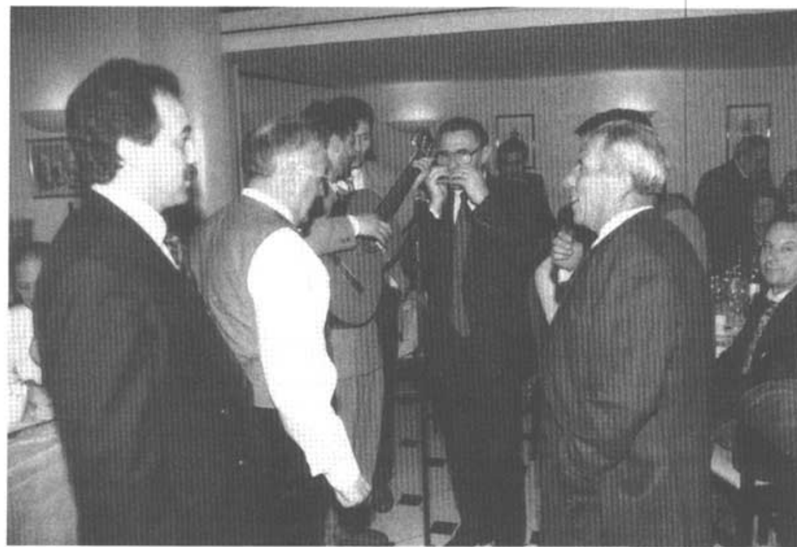
Roma 17.4.93: allegria fra i convitati.

In apertura del dibattito ha portato il suo saluto ed il suo contributo il